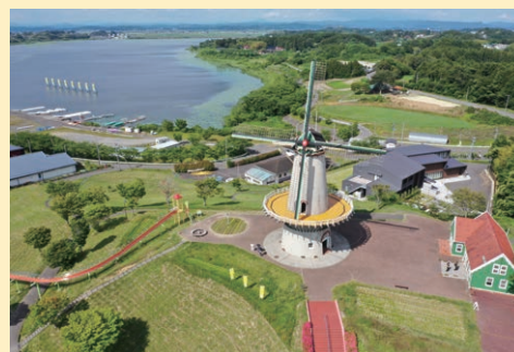
長沼フートピア トヨタツの丘公園

※面積は国土地理院「全国都道府県市区町村別面積調」に、 人口は「住民基本台帳」による。