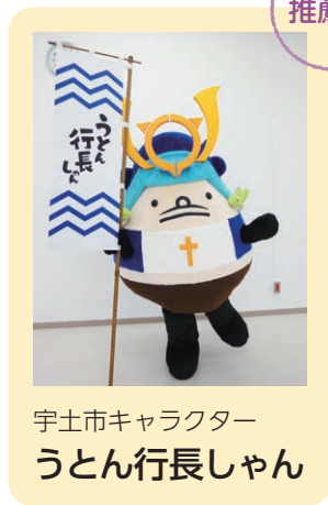
宇土市キャラクター うとん行長しゃん

九州のど真ん中に位置する宇土市は、有明海の豊かな栄養分を受けて育つ香り豊かな海苔の一大産地です。特に初摘み「一番摘み海苔」は、繊細な風味と柔らかな食感で高い評価を得ています。新鮮で高品質な海苔は、和食やおにぎり、パスタなどさまざまな料理でそのおいしさを堪能できることはもちろん、贈答品としても喜ばれること間違いなしです。ぜひ、宇土市の味わい豊かな海苔をお楽しみください。