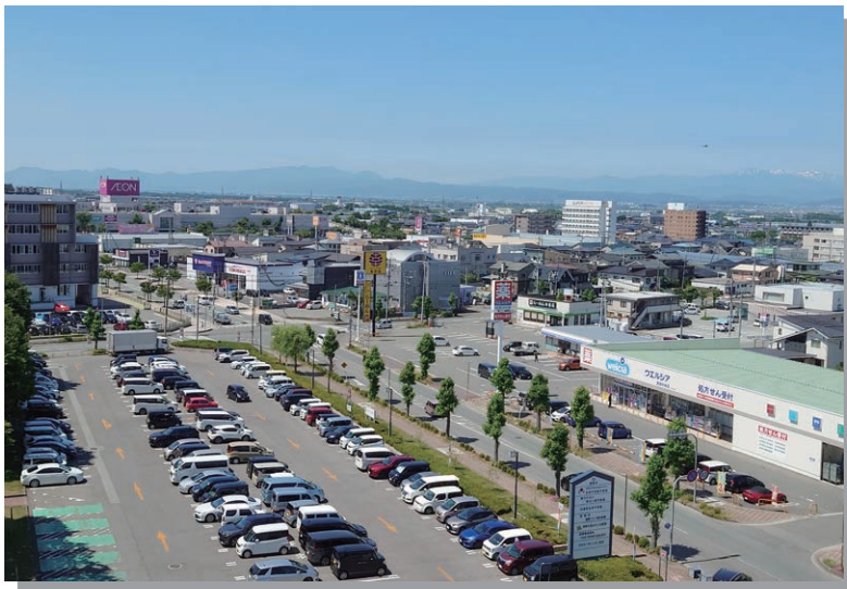
コンパクトに整備された 中心市街地