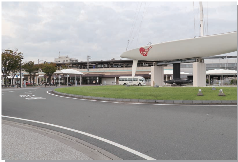
蒲郡駅南広場「平成17年に 高架化が完了し現在の姿に」