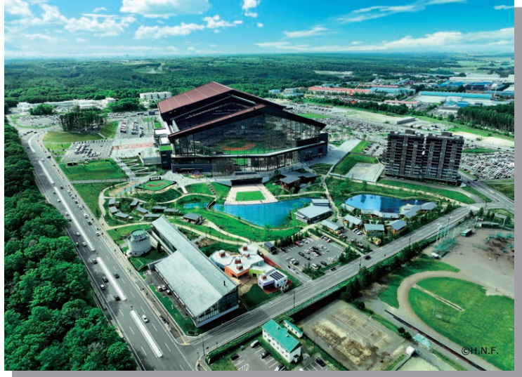
北海道ボールパークFビレッジ