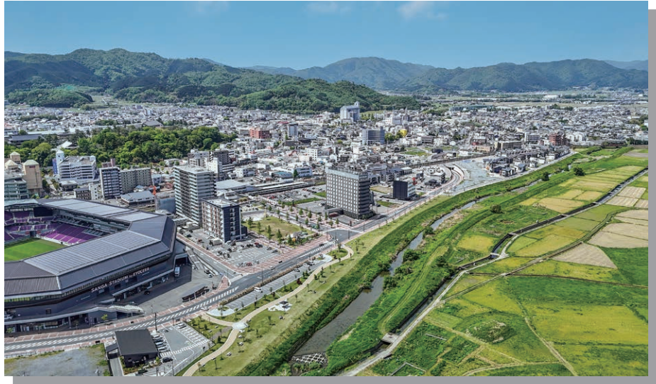
スタジアムやホテル、マンションなどが立ち並ぶ